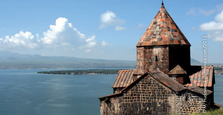
Mittelalterliche Kirche am Sevan See