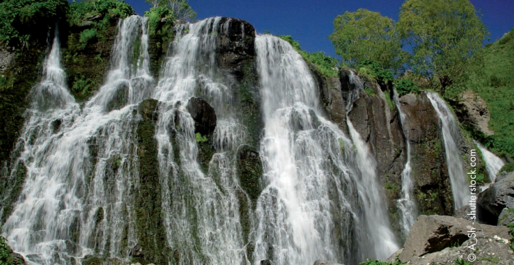
Shaki Wasserfall in Armenien